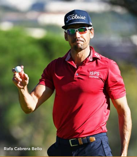
Rafa Cabrera Bello